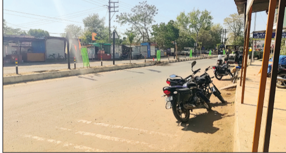
हरिभूमि न्यूज | सिलवानी

मौसम ने करवट लेना शुरू कर दिया है। सर्दी अब विदाई की अंतिम बेला में पहुंच चुका है और दोपहर होते ही गर्मी लोगों को सताने लगी है। बीते कुछ दिनों के समय चटक धूप का असर साफ दिखाई दे रहा है। हालांकि सुबह के समय अब भी हल्की सर्दी का अहसास बना हुआ है। नगर के प्रमुख स्थल बजरंग चौराहे पर अल सुबह से देर रात तक रहने वाली रौनक में कमी देखी गई। दोपहर के समय बाजार में