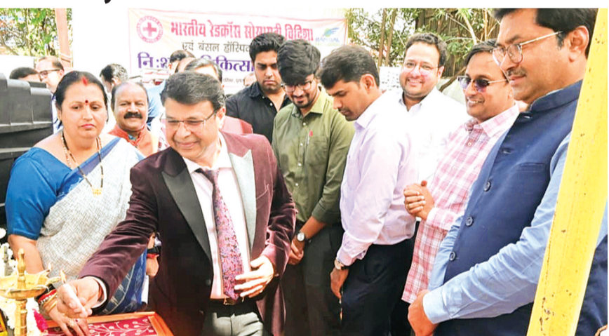
हरिभूमि न्यूज ▶ विदिशा

रविवार को पुरानी अस्पताल स्थित ब्लड बैंक परिसर में भारतीय रेड क्रॉस सोसाइटी द्वारा निःशुल्क स्वास्थ्य शिविर का आयोजन किया गया। शिविर में बंसल हॉस्पिटल, मोपाल के विशेषज्ञ डॉक्टरों ने विभिन्न बीमारियों से पीड़ित मरीजों की जांच कर उन्हें आवश्यक परामर्श दिया। कार्यक्रम का शुभारंभ कलेक्टर