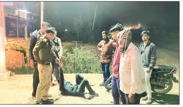
हरिभूमि न्यूज | सलामतपुर

कस्बे में एक बार फिर तेज रफ्तार कार का कहर देखने को मिला। जहां एक कार चालक ने पेट्रोल भरवाने जा रहे युवक की मोटरसाइकिल को टक्कर मारकर उड़ा दिया। टक्कर से बाइक चला रहा युवक दूर जा गिरा और घायल हो गया। वहीं तेज रफ्तार कार चालक मोके से फरार हो गया।