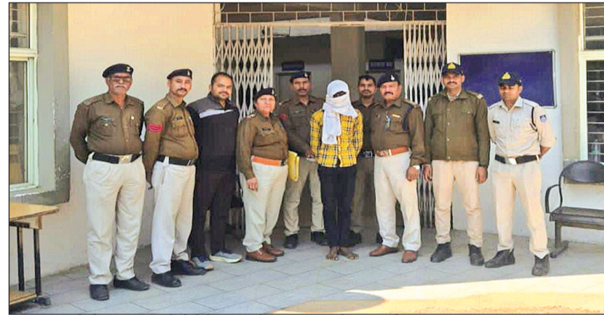
विदिशा। तकनीकी साक्ष्य और सीसीटीवी फुटेज की मदद से आरोपी तक पहुंची करारिया पुलिस।

कोठीचार खर्द में एक बुजुर्ग महिला के साथ दुष्कर्म के बाद गला दबाकर हत्या के सनसनीखेज मामले में करारिया पुलिस ने खुलासा कर दिया है। महिला की हत्या करने वाला कोई और नहीं उसके घर के सामने रहने वाला एक युवक ही निकला। पुलिस ने आरोपी को गिरफ्तार कर न्यायालय में पेश किया जहां से उसे जेल भेज दिया गया है।