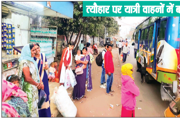
त्यौहार पर यात्री वाहनों में बड़ी भीड़, बसों की इड़ताल भी स्थगित

होलिका दहन की तैयारियां भी जोरों पर हैं। शहर के विभिन्न मोहल्लों में होलिकाओं को सजाने का काम अंतिम चरण में है। वहीं कई स्थानों पर पारंपरिक शैली में होलिका एवं भक्त प्रह्लाद की भी प्रतिमाएं बुलाई गई हैं। कई स्थानों पर पर्यावरण संरक्षण को ध्यान में रखते हुए गोबर से बनी गौकाष्ठ का उपयोग किया जा रहा है। आयोजकों का कहना है कि इससे लकड़ी की बचत होगी और प्रदूषण भी कम होगा।