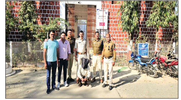
हरिभूमि न्यूज | रायसेन/बाड़ी